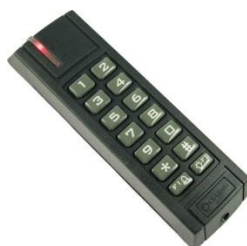
obr. 1 - klávesnice Jablotron JA-80H