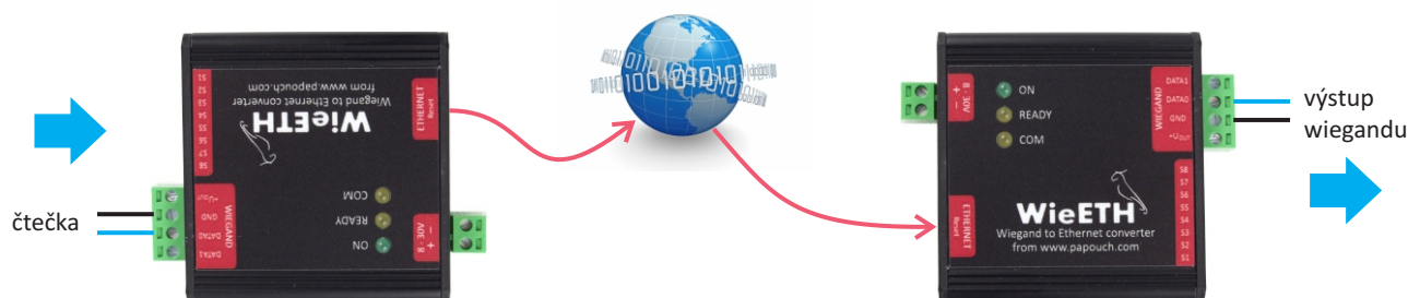
Zapojení sady prodloužení přes Ethernet (WiegandLongEth)

Na papouch.com je k dispozici také podrobná dokumentace WIEETH, včetně návodu jak změnit síťové parametry převodníku.